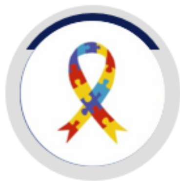
PESSOAS COM TRANSTORNO DO ESPECTRO AUTISTA