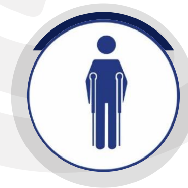
PESSOAS COM MOBILIDADE REDUZIDA