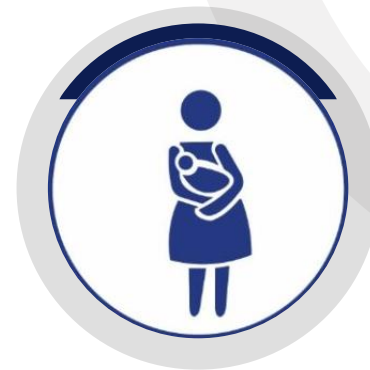
PESSOAS COM CRIANÇAS DE COLO E LACTANTES